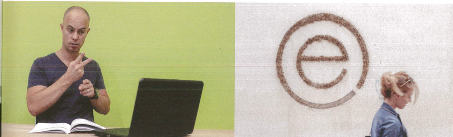
Buchführung, International Sign, Deutsch für Migranten: Das Angebot des vielfach ausgezeichneten Unternehmens equalizent ist breit

Von den Dozenten wird Flexibilität erwartet: Böhm vereinbart die Kurstermine individuell mit den Teilnehmern. „Falls jemand verhindert ist, können wir den Termin auch ganz ausfallen und ver-